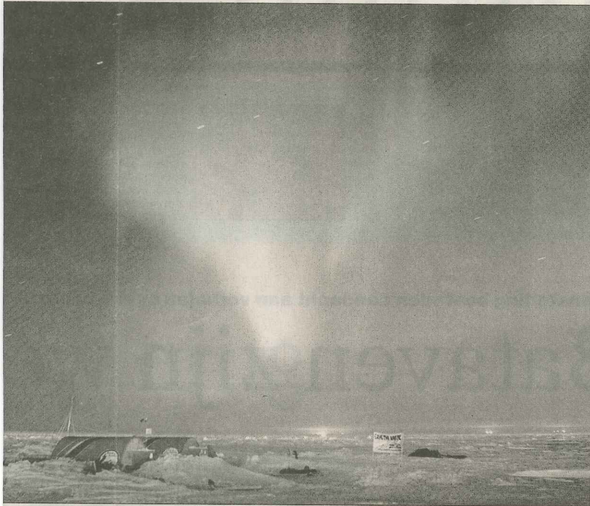
in Alaska, Kanada en oan syn jonge jierren yn It Paradys en Dokkum wurde ophongen oan it aktuele barren fan